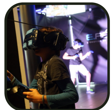
Immersion totale !

Direction Grenoble pour découvrir la ville d'un tout nouvel œil ! Nous aurons un guide rien que pour nous, qui nous fera déambuler dans la ville et nous livrera tous ses secrets... Nous irons ensuite à E.Réel afin de se faire une bonne session de réalité virtuelle, à base d'escape game et de jeux de tir. Plus vrai que nature !