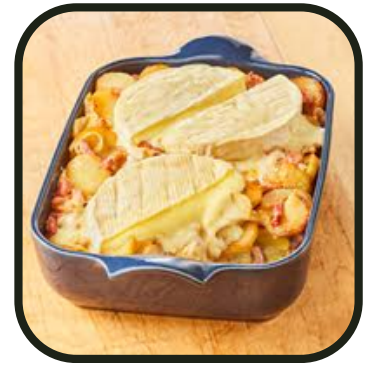
Bien réconfortant ça

Un peu de sport, ça vous tente ? On vous propose d'aller passer l'après-midi à Hapik, la salle d'escalade de Neyrpic ! Puis après l'effort, le réconfort. Direction Saint Jean pour une veillée comme on les aime : une bonne tartiflette bien diététique (...), pour finir sur un grand Burger Quiz ! Alors, ketchup ou mayo ?!