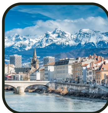
Cularo / Gratianopolis