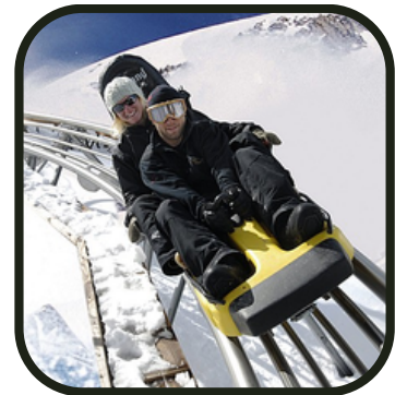
... mais ça, oui !

La fameuse ! Votre programme, votre journée (on reste avec vous quand même hein). Quel programme aurez-vous concocté ? Du sport ? De la culture ? Quelque chose d'artistique ? Ou à sensations ? Ce qui est sûr : une journée qui vous ressemble ! On a trop hâte de voir ce que vous nous réservez.