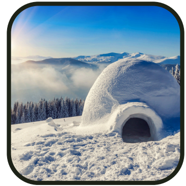
Comme les Inuits !

La montagne, ça nous gagne ! On prend une tenue chaude, et on commencera la journée par une session patinoire. Vous êtes plus boucle piqué ou triple axel ? Ensuite ce sera direction le grand air pour aller construire des igloos ! Oui oui, un gentil moniteur nous accompagnera pour nous apprendre l'art de la construction de cet habitat si original. On pourra peut-être prendre le goûter dedans ?!