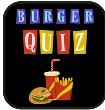
Chez Wam !