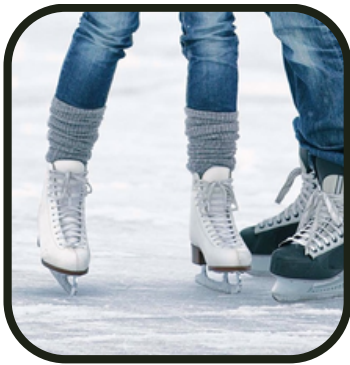
Attention sol glissant