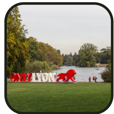
... mais on évitera de ploufer là

On va se transformer en gones le temps d'une journée. Tout d'abord en parcourant l'immense et magnifique parc de la Tête d'Or ! Attention, double ration de goûter pour celui ou celle qui trouve cette fameuse tête de lion en or massif... Et histoire d'oublier le froid de l'hiver, direction le City Surf Park pour un avant-goût estival ! Alors, prêts à tenter un alley-oop sur une backwash ?! Pense à ton maillot de bain !!!