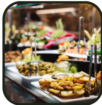
On vous connaît par coeur