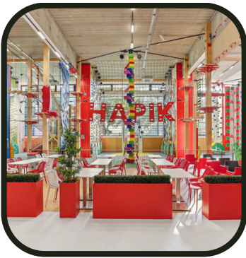
Prêts pour la grimpe ?