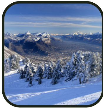
C'est beau Villard de Lans