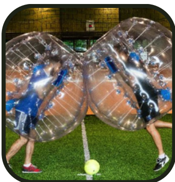
Et bim !