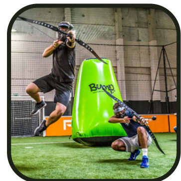
Robin des Bump

On commencera cette deuxième semaine avec un atelier artistique : décolorer du tissu avec de la javel pour un rendu unique et personnalisé ! Avec toutes les normes de sécurité, bien évidemment. Sans oublier la préparation de la journée OFCV ! Pour l'après-midi, direction Meylan pour aller faire du bubble foot et de l'archery bump !