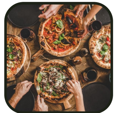
Partager un bon repas

La belle journée durant laquelle on fusionne avec une autre structure. Quoi de mieux pour de nouvelles rencontres qu'un grand jeu en plein air ? On vous emmènera l'après-midi faire un Robin des Bois mais avec une particularité : des Nerfs ! Après s'être bien dépensés, direction la Comédie de Grenoble pour aller voir la pièce "Ado un jour, à dos toujours". Et pour bien clôturer cette veillée, un repas tous ensemble pour échanger sur cette journée au top !