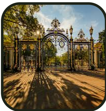
Sacré portail !