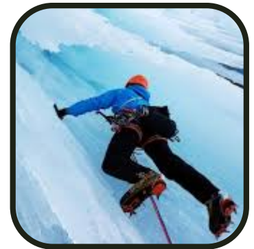
... mais pas insurmontable !

Nous irons à Lans en Vercors avec Alpidyllik pour entreprendre l'ascension d'une cascade de glace ! Pour cela, veille bien aux instructions suivantes : 2 paires de gants (1 fine + 1 épaisse et imperméable), bonnet (sans pompon!), pantalon chaud mais pas large (ex. : pantalon de ski de fond). Ca va être fou !