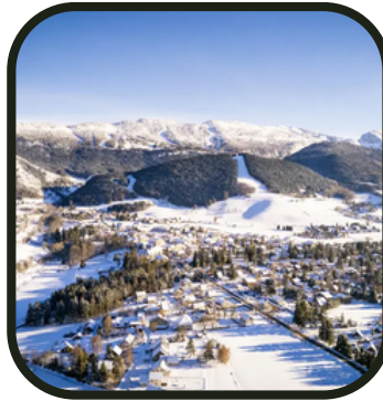
Direction la montagne