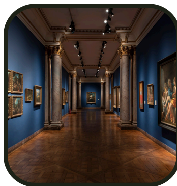
Le musée, c'est une possibilité !