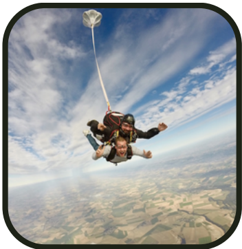
Alors pas ça malheureusement ...