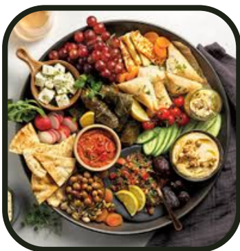
Et pourquoi pas libanais ?