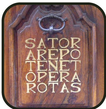
C'est à dire ?