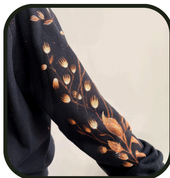
Oui oui, qu'avec de la javel