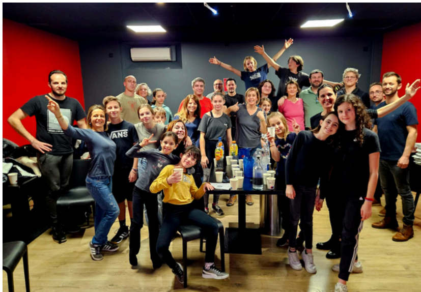
Dernière soirée familles au top !

Alors attention... z'êtes prêts pour les inscriptions ?... TOP C'EST PARTI !!!!!