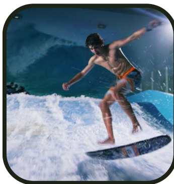
Comme en été...