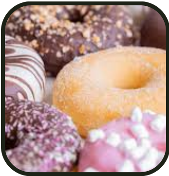
Ouh pinaise !