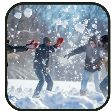
Ou une bonne vieille bataille de boules de neige

Voilà, on y est ! Pour ceux qui ont préparé la journée, c'est la consécration, on finit en beauté ! On vous écoute et on vous suit dans vos délires, et surtout vos envies quelles qu'elles soient. La seule contrainte, le budget imposé à respecter ! Le moment de la semaine où vous êtes les patrons. Alors on compte sur vous pour finir les vacances en beauté ! A vous de jouer !!!