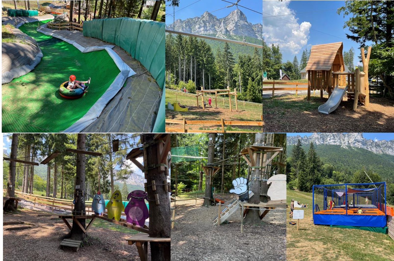
Col de Marcieu été 2023