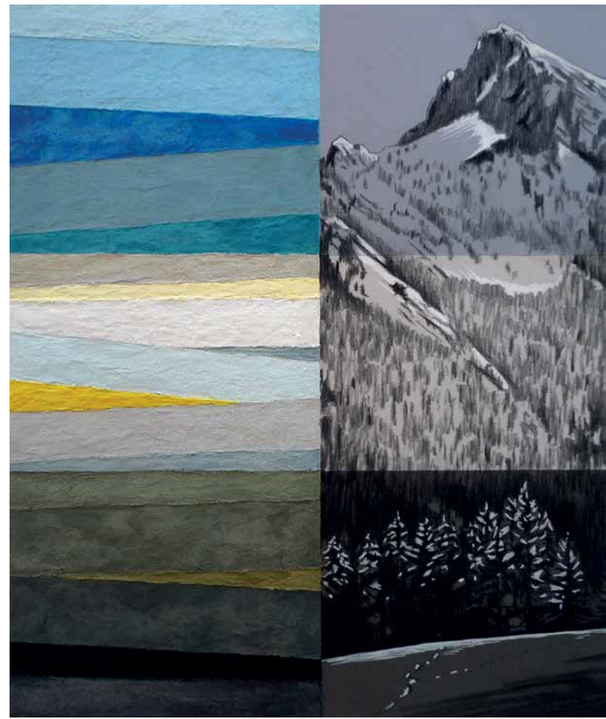
« Grand Som »