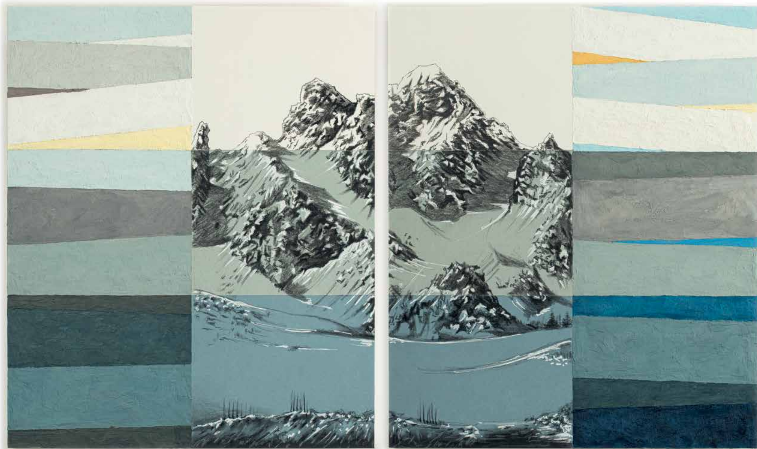
« Dent de Burgin »